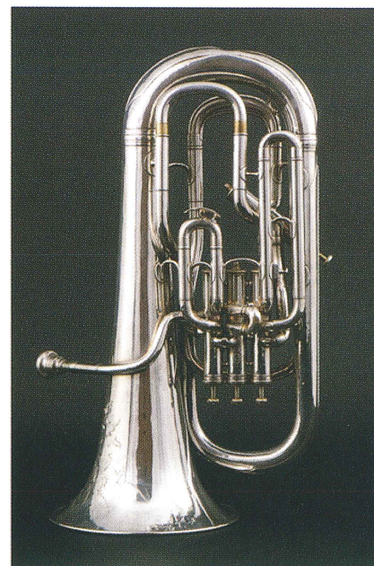
ブージー (Boosey & Co.) 製 ユーフォニオン 1897年製 ロンドン