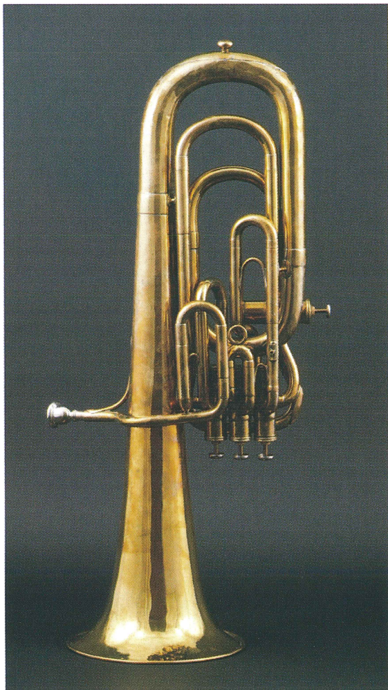
アドルフ・サククス (Adolphe Sax) 製 サクソルンバス 1866年製 パリ